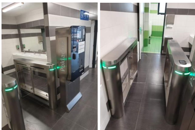
Obrázek B.1 - Turniket - dvoukřídle provedení (Speed Gate)