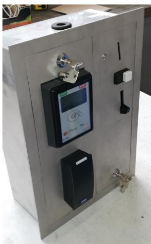
Obrázek B.3 - Automat dveřního zámku